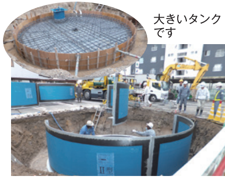
大きいタンクです

城北コミュニティセンター東側の駐車場での耐震性貯留槽設置工事は当初予定していた12月25日より若干遅れ、来年1月末に完成する見通しです。