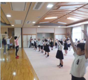
一緒に頭の体操を

パソコン教室も見学、調理室では「まえにお母さんと料理してきたことがあるよ」という声も聞かれました。