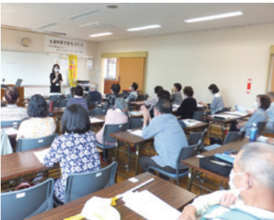
税をわかりやすく

受講者は、現在の国の予算で税収は3分の2にとどまり、残りは借金(国債)となり、今後も借金総額が増加する見込みであることを知りました。 (文化部会)