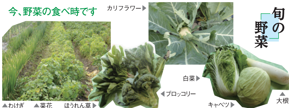
▲わけぎ ▲菜花 ほうれん草 ▶ カリフラワー ▶ 白菜 ▶ ブロッコリー ▲キャベツ ▲大根