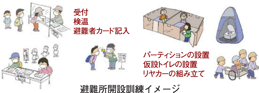
避難所開設訓練イメージ

城北コミュニティだより「ともしび」編集・広報部会 年間4回発行(1月、4月、7月、10月の各1日付)