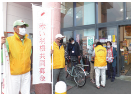
よろしくお願ひ致します