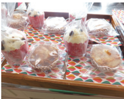
おいしそうなケーキですネ