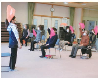
おととつと、落とさないで