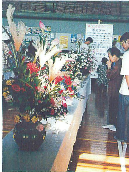
汗の結晶が並んだ作品展会場