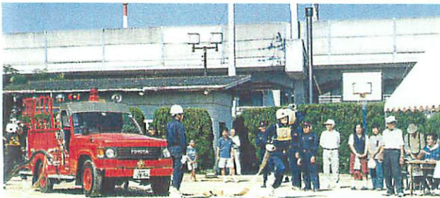
▲どれにしようか。交通安全ポスター人気投票 ▲テキパキとしたポンプ操法も披露