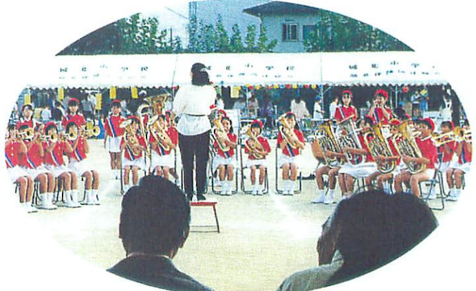
まつりのオープニングを飾った城北小マーチングバンド