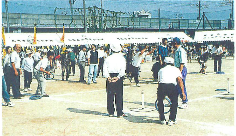
人気の輪投げ。ボールに入っても入らなくても歓声上がる