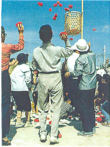
昔取ったきねづか?でもうまいかない