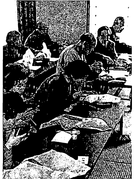
和気あいあいの会食(城東町自治会館で)