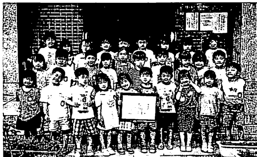
交通安全の表彰状を手に喜ぶの園児たち

緑地公園に今年もさまざま まな花が咲き、そしてピワ や梅、姫リンゴなどさまざま まな実がつき始めています。 やがて、だんだん大きく なり色づいていく。そんな 様子を子ども達は、無意識 にあるいは、お家の方や先