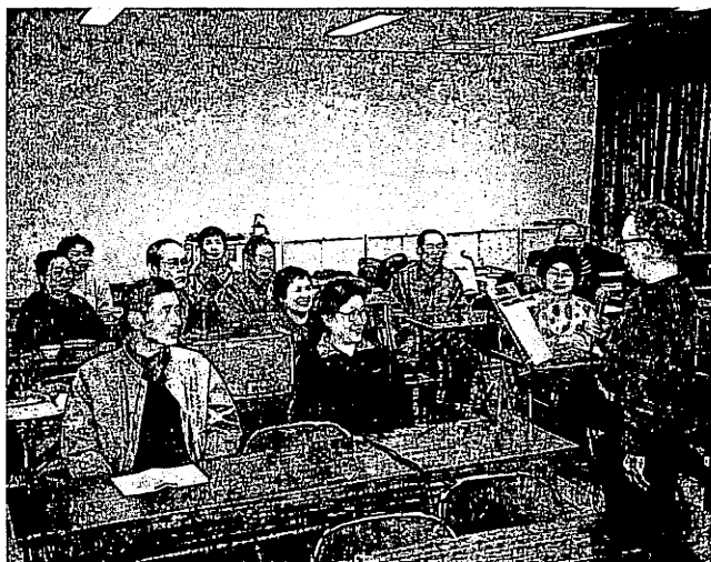
丸亀カラオケクラブの例会風景 (城北コミュニティセンターで)

婦人学級の場合、学習行事の予定は次の通りです。 五月十日 開講式、出前講座 五月十五日 健康教室、衛生講座 七月十二日 趣味の会 八月二日 料理教室 九月十三日 出前講座 十月十一日 料理教室 十一月 室 カラオケ園芸など