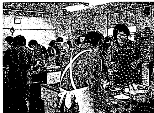
婦人学級では教養や趣味に関する講座が開かれる (土器コミュニティセンター婦人学級から)