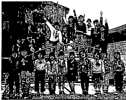
みんな仲間。ピッカピカの一年生

この一年間、保育所では「親子のふれあい」をテーマに数々の行事に取り組みでまいりました。自然を目で、耳で、肌で感じながら、親子で季節を見つけたたり、身体をふれあつた体操やゲ