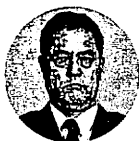
番 交 器 器 所 長 替 替 長 替 替

コミュニティとの共同事業として行われるものです。起工式には片山市長、地元関係自治会長らも出席しました。碑の除幕式は五月五日の予定。