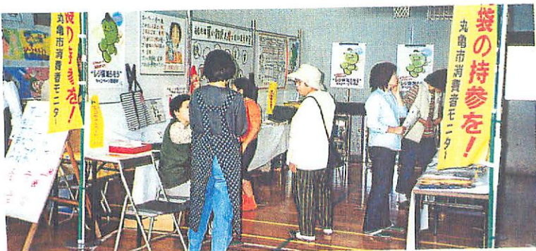
上ノモニターさんも初参加 中ノタイヤコロガシ 下ノたべものひろば。「お父さんまってるヨ」