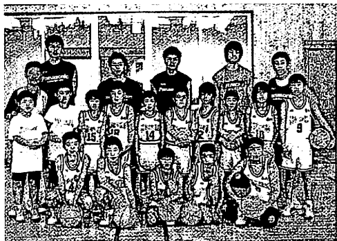
県大会で初優勝した城北ミニバス少年団のメンバー