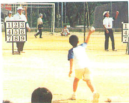
右ノストライキングゲーム 下ノ豆の置きかえ