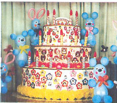
2メートルもあるジャンボケーキ

お祝いを終えて「ほくほくさっさ」に立ち寄ると何とウエイトレスは子ども達。しかも特製ケーキは地域の方や保護者がいっしょになって、畑で栽培したさつまいもを材料にしてつくりました。子ども達にはこの味をそっとしまっておいてと願いました。