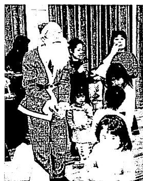
サンタからうれしいプレゼント