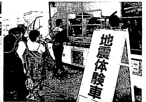
地震体験車に順番待ちの行列が出来た

今回は地震体験車も登場。順番待ちの行列も出来、関心の高さを示していました。その横では災害時のサバイバルについて説明がおこなわれました。