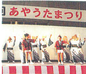
老いも若きもそろって岡田おどり