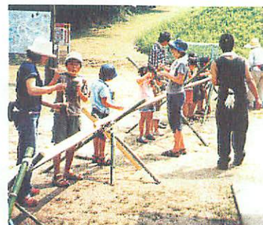
流しそうめんおいしい!(森林公園で)

合併による都市と農村、人と人との交流が広がります。地域の良さを理解しあつてと意欲を燃やしています。