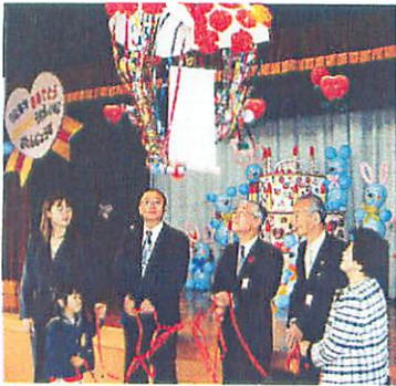
大きなくす玉でお祝い

まるで夢のようです。園児が主役というスローガンで演出されたお祝いは、特大のパーズデーケーキや、