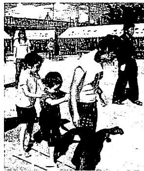
“苦戦”のムカデ競走に大きな声援が飛んだ