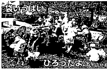
城北小 学校東側の東汐入川縁道公園の清掃が平成十六年十月一日行われ、きれいな公園に生まれ変わりました。

城北コミュニティセンターも災害時には避難場所となりますが、道路に面したセンターの一角に「緊急避難場所」の標識Ⅱ写真Ⅱが建てられました。緑色地に白い文字で書かれ、遠くからでも分かります。緊急時というより、日ごろから避難場所の認識を持つてもらうためのものです。