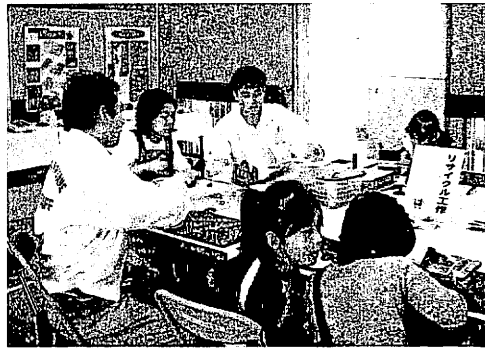
今回初めて登場したりサイクル工作

チング演奏、平山保育所幼児の演技などに続いて、各種競技が開かれ、歓声が沸きました。体育館では大人や幼児・児童の作品を展示。交通事故防止、健康、消費者モニターなどのキャンペーンもあり、多くの人が見入っていました。また、幼児の落書きコーナー、エコ丸工房によるリサイクル工作が人気を集めました。