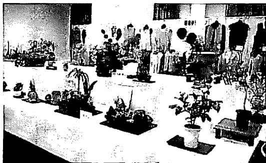
目をみはる作品ぞろい

展示会場の作品はいずれも力作揃いで苦心のあとが見えかくれし、色彩豊かな絵画、書、丹精こめた陶芸や服飾の