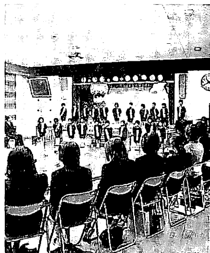
【城北幼稚園】（3月19日）修了児21人。 式をしめくくる思い出のアルバムが映し出されると、保護者は子供の成長ぶりに感激のようすだった。▶