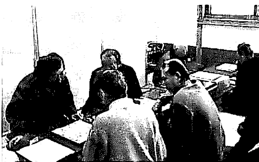
老いも子どもも将棋に夢中

また平山保育所幼児の軽快な鼓隊演奏、各クラブの演技は日頃の学習の積み上げの成果が表現されていました。初めて参加した将棋クラブ