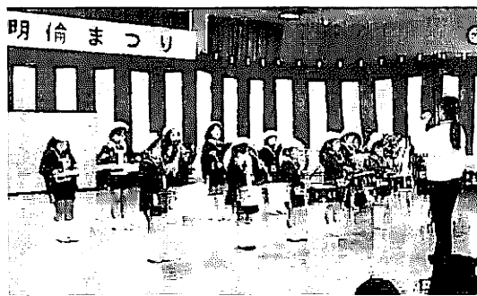
「手のひらを太陽に」を元気に演奏

開会式に続いての舞台では、いつまでも元気にをモットーに活動している「いす体操」で幕を開け、会場から大きな拍手を浴びました。