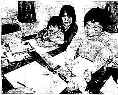
ハーブのいい香り