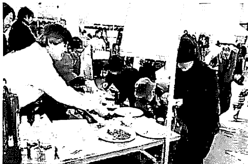
非常食を試食して