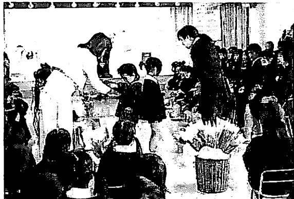
【平山保育所】（3月24日）修了児20人。 修了証書を受け取った児童は、父母らに「送り迎えありがとうございました」と証書を手渡しました。▼

3月は卒業、修了式シーズン。厳粛と華やかさが交差する中を生徒・児童たちは、たくさんの思い出を胸に旅立ちました。