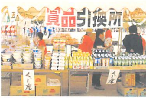
“アッ”という間に完売

の協力を得て、二足歩行のロボットやラジコンカーの操作体験。工作教室（木登りテントウ虫）には、子どもたちは喚声を上げ、大人たちも初めて見るロボットの動きの不思議さに驚いていました。