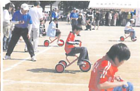
しっかり踏んでネ

昨年の11月22日全国ロボットコンテスト2009に出場し「ダンス」の部で100点