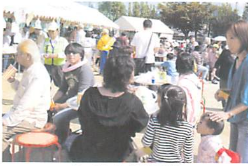
青い空 この街は元気