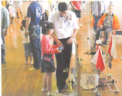
科学への芽生えを願って