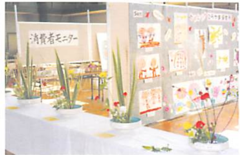
花のいろ 絵の輝き 個性豊かに