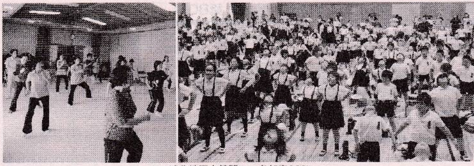
城北地区大健闘……参加率92%

5月27日、住民総参加型のスポーツイベント「チャレンジデー2015」が全国130市町村で一斉に行われ、丸亀市は友好都市の秋田県由利本荘市（人口約8万人）と対