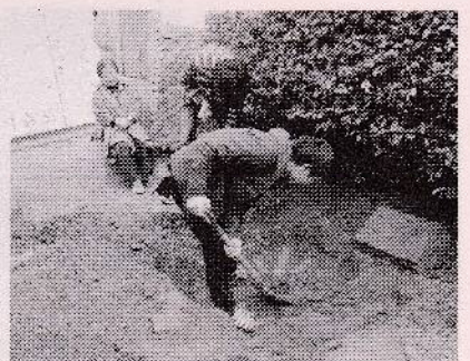
タイムカプセルはどこ？