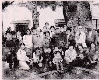
金陵の郷 大楠の前で

4月5日、「こんぴらさん」へバスハイイクを行いました。あいにくのお天気でしたが、30人の参加があり、琴平駅や高燈籠、金陵の郷や海の科学館、公会堂などを見学しました。公会堂では、歌舞伎の写真をとり、今まで来た