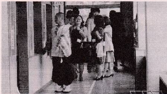
教室ってこんなに小さかったのかな

◇平成16年卒・女 楽しかった学校、修学旅行、友達。思い出はいつまでも忘れられません。