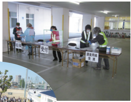
検温・消毒をして受付