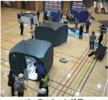
パーティション設置