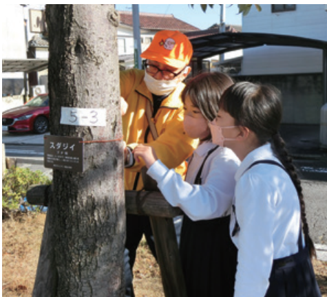
うまく結べるかな

讃岐三畜を使った料理教室を9月30日、コミュニティセンターで開き約20人(男性3人)が参加しました。 ヘルスメイトによる讃岐三畜や献立の説明のあと、各班に分かれて、早速調理開始しましたが、男性陣の手さばきの良さにはびっくり。コロナ禍とあって皆さん、弁当にして持ち帰り、各家庭で賞味しました。