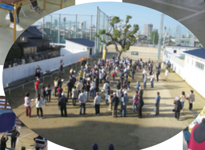
開会式・訓練の説明