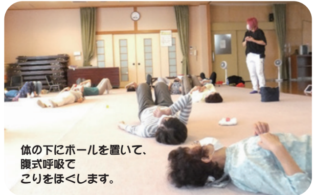
体の下にボールを置いて、腹式呼吸でこりをほぐします。