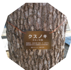
歩道から見える様に