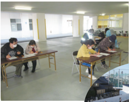
入所カードの記入

災害の少ない香川県ですが、全国各地では地震が相次いでいます。近く発生すると言われる南海トラフでの大地震では、住民が安心できる避難所が開設されることを、願っています。 (防災会)