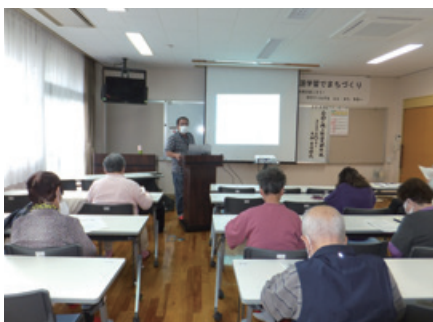
おへんろ文化について聞き入る参加者