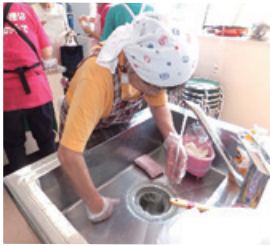
後片づけも丁寧に