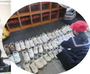
大人も真似しなくちゃ